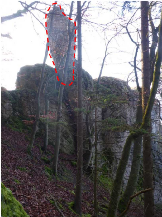
Abb. 1: schiefstehender Felsturm mit aufgelockertem Fußbereich, Foto: 13.12.2017

Anlage: Bildaufnahmen gefährdeter Großblöcke der Zentralstelle für Ingenieurbauwerke und Georisiken vom 13.12.2017