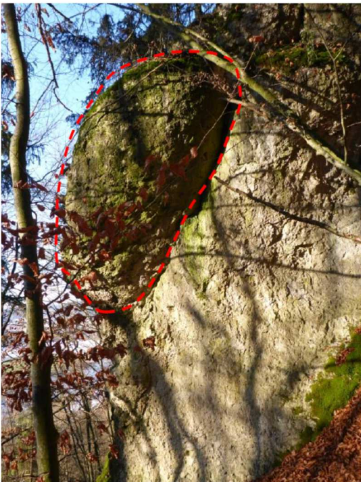
Abb. 4: beinahe vollständig vom Muttergestein getrennte Felskugel, die lediglich durch ein brüchiges Auflager noch vor Ort gehalten wird, Foto: 13.12.2017