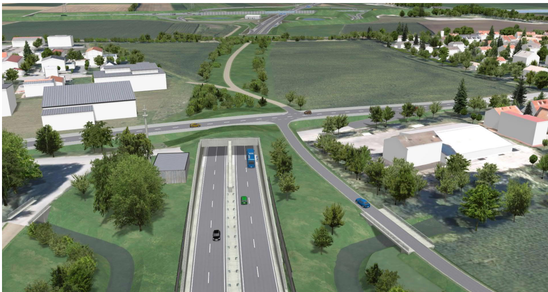
Visualisierung B 15n, Bauabschnitt I, Tunnel Ohu Südportal, Quelle Staatliches Bauamt Landshut